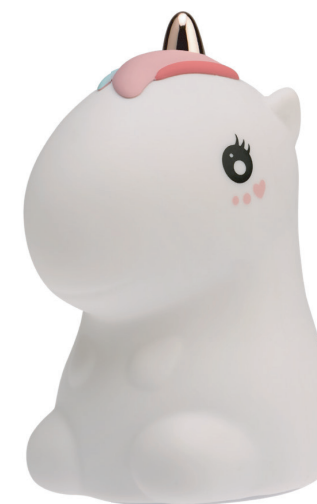
Арт. 503-003 «Единорог»