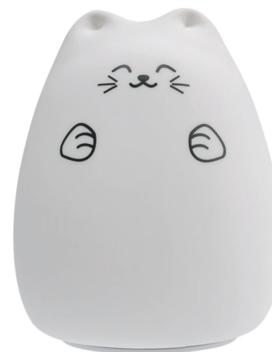
Арт. 503-001 «Котик»